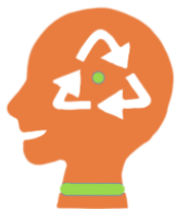
Ногоон ур чадвар