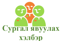
Сургал явуулах хэлбэр